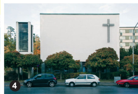
4 Sättra kyrka är ett tidstypiskt exempel på 1960-talets kyrkobyggnad, omsorgsfullt men modernistiskt utformad.