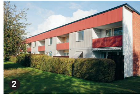
2 De ovanligt gestaltade radhusen i kv. Gillsättra är ett bra exempel på 1960-talets industrialiserade småhusbyggnad.