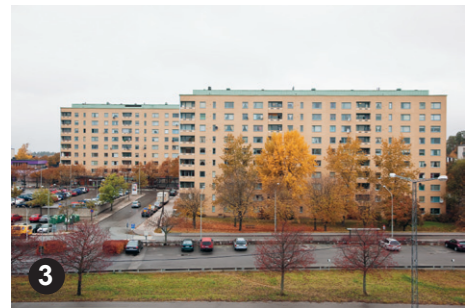
3 De tre skivhusen som flankerar Sättra torg utgör stadsdelens enda äldre höghusbebyggelse.