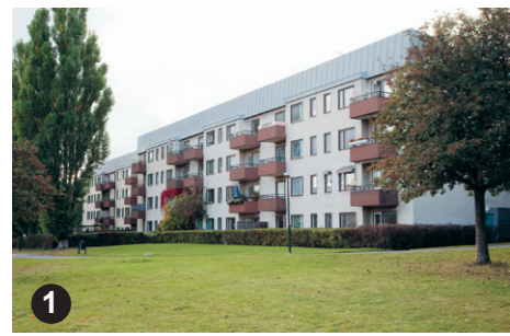
1 De omsorgsfullt utformade lamellhusen i kv. Hällsättra 6 bildar en sammanhängande fond vid Sätredalsparken.